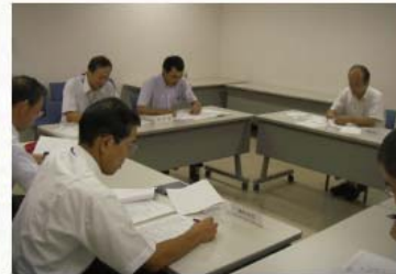
発注者支援業務（技術審査（総合評価）補助業務）