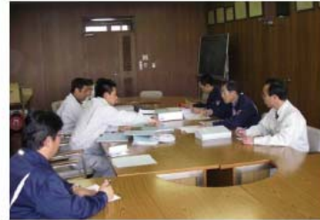
発注者支援業務（検査補助業務）