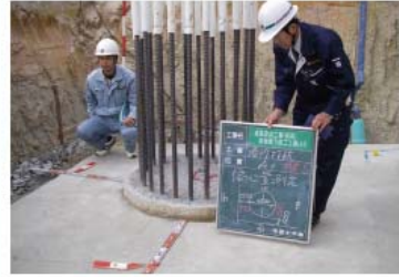
発注者支援業務（監督補助業務）

発注支援業務として、設計積算補助、監督補助、検査補助、技術審査（総合評価）補助の4業務を行います。業務の効果として、施工・目的物の品質向上に寄与します。